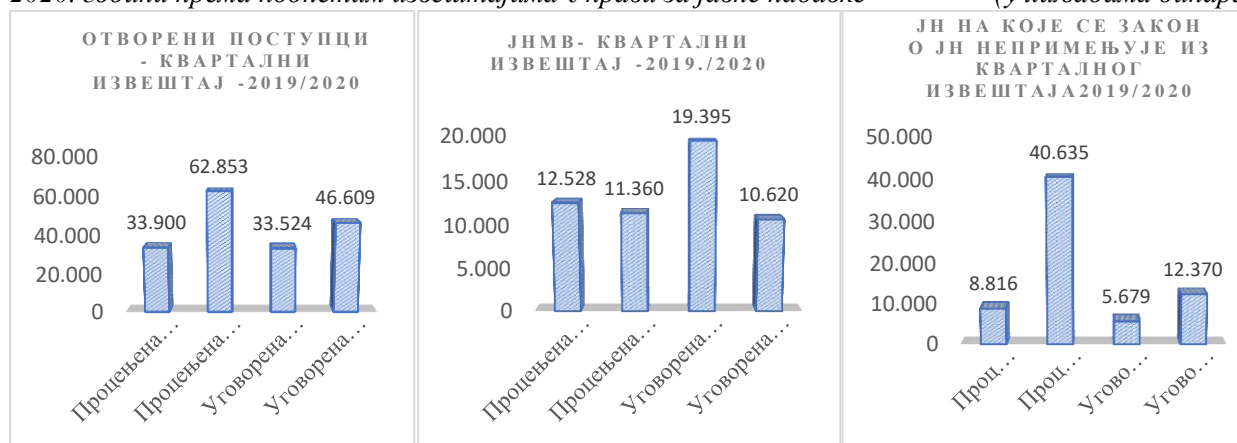
Слика број 2: Упоредни преглед процењене вредности и закључених уговора о набавкама у 2019. и 2020. години према поднетим извештајима Управи за јавне набавке 51 (у хиљадама динара)

Дом здравља је благовремено 14. јануара 2021. године објавио на Порталу јавних набавки податке о вредности и врсти јавних набавки из чл. 11–21 овог закона, и то по сваком основу, као и јавне набавке из члана 27 став 1 раније важећег Закона о јавним набавкама.